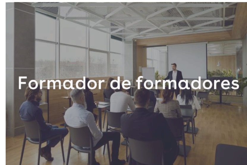
Formador de formadores