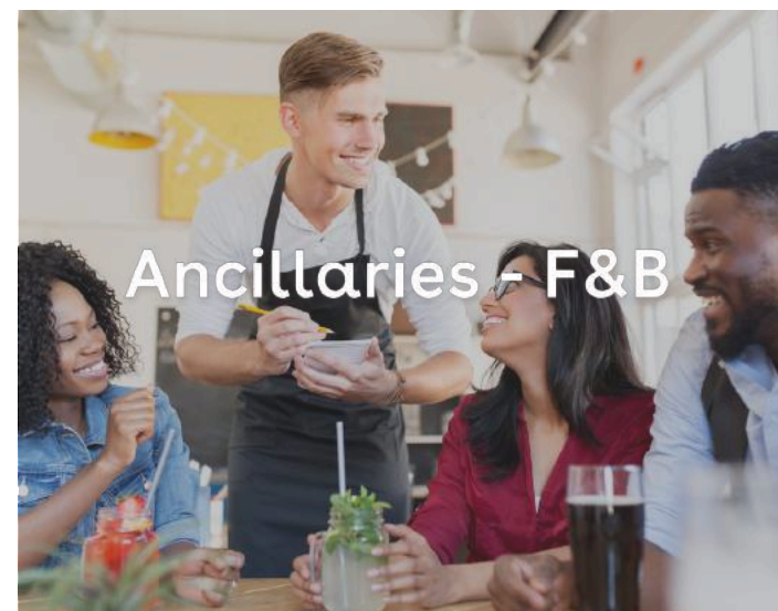
Ancillaries - F&B