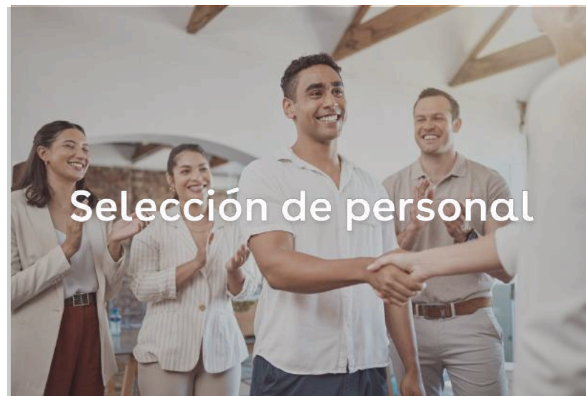
Selección de personal