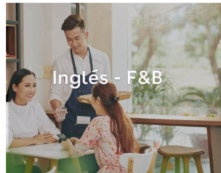
Inglés - F&B