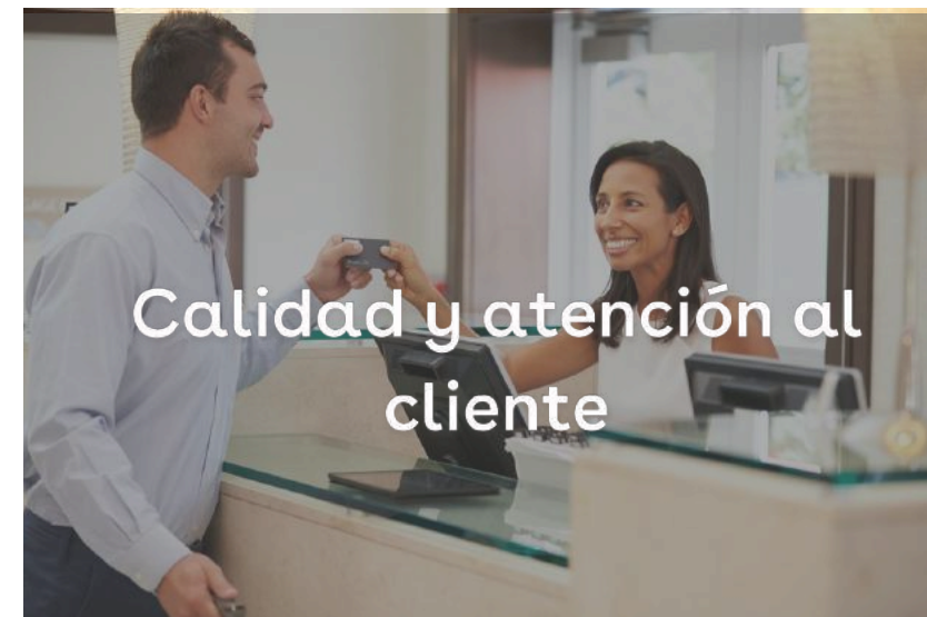
Calidad y atención al cliente