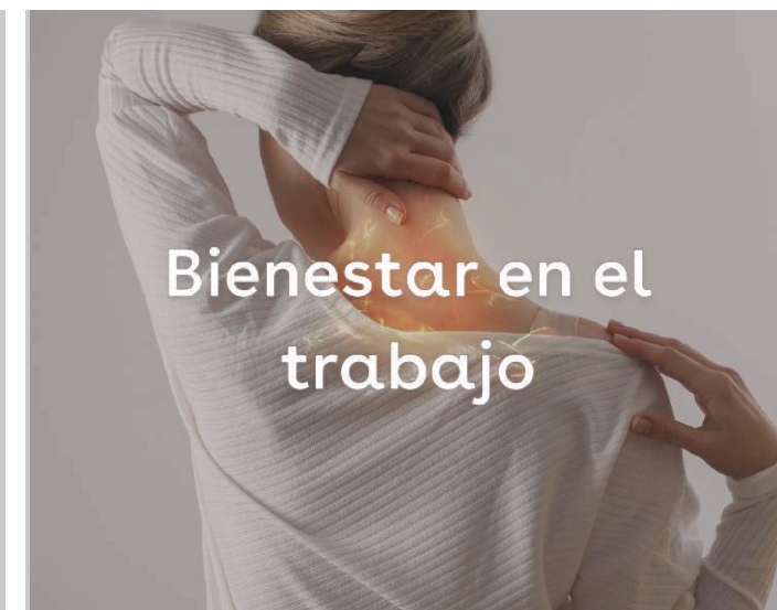
Bienestar en el trabajo