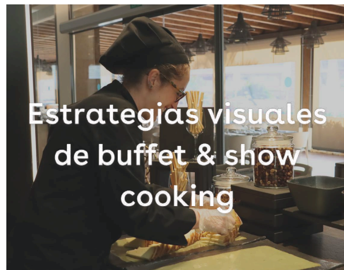
Estrategias visuales de buffet & show cooking